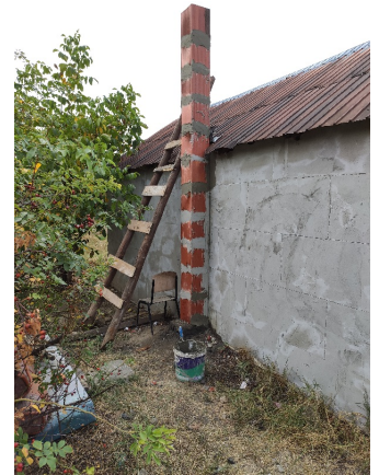
nieuwe WC en schoorsteen, met de makers