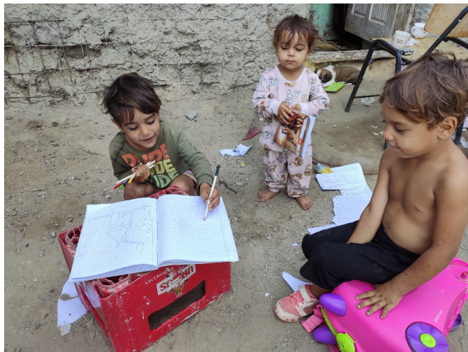
Bij gebrek aan een tafel gebruiken de kinderen dan maar een kratje om op te tekenen

Deze Jurnal kwam geheel zonder AI tot stand!!!