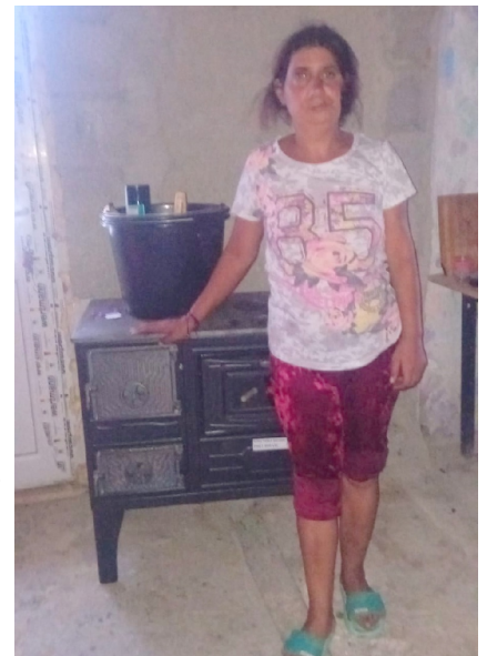
Een metalen houtkachel

Ieder jaar krijgen we van verschillende families te horen dat ze geen kachel hebben en of wij kunnen bijspringen. Aansluiting op het gasnet en een CV-installatie is voor deze families uitgesloten en enorm kostbaar, ook in gebruik met vastrecht e.d.. De enige mogelijkheid is dan een terracotta of een metalen houtkachel. De terracotta kachels blijven na opwarming heel warm en bij de meeste kun je er ook op koken. De metalen kachels zijn goedkoper, blijven minder lang warm maar je kan er ook op koken. Daarna moet er nog een pijp door muur of plafond/dak worden gemonteerd. Ook deze materialen worden direct bij de kachels afgeleverd en eventueel ook stenen voor een nieuwe schoorsteen.