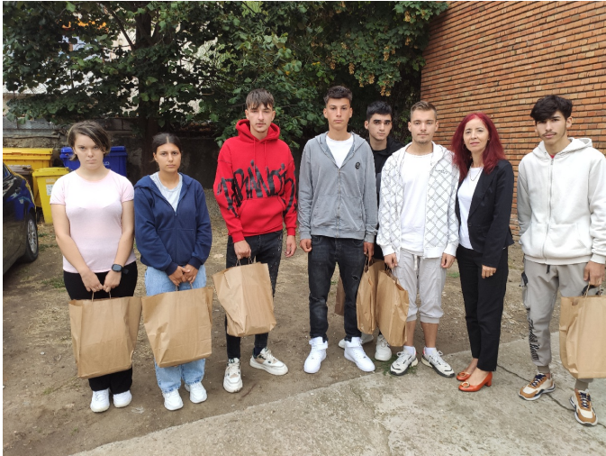
Leerlingen van de Industrieschool

De totale kosten van het project "Kind naar School" komen dus op € 6370. De overheadkosten voor zaken als transport, telefoon en administratie zijn te verwaarlozen.