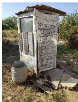
De oude 'WC'