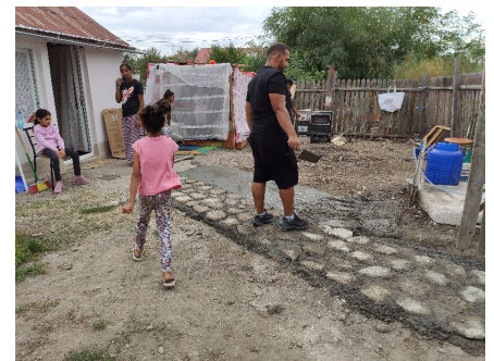
wasmachine en stenen paadjes op het erf