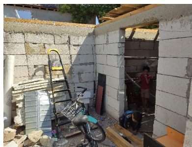
situatie voor en na