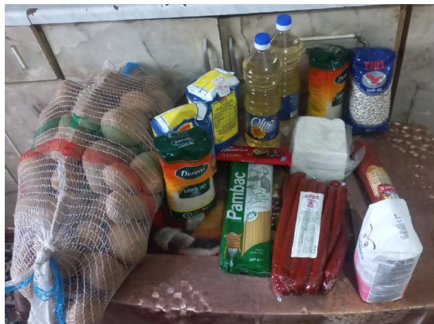
het pakket van 2024