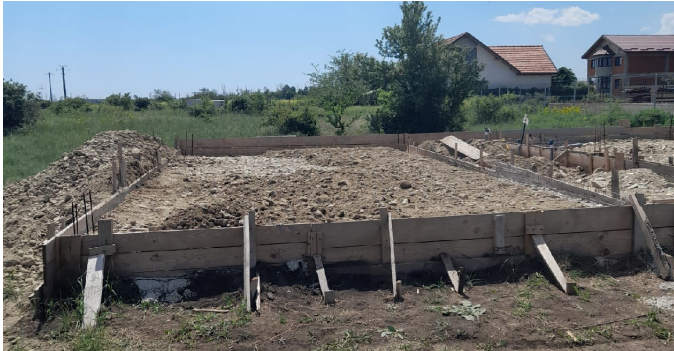
De fundamenten in aanbouw in 2024

ad hoc loonwerker in de bouw hebben ze stenen kunnen kopen om de muren op te trekken. Dat doet de man zelf, samen met een kennis. Helaas hebben ze het huis veel te groot ontworpen waardoor alles veel duurder uitpakt dan bij het kleine huisje van Feraru.